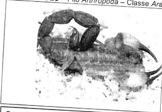
Escorpião preto ou marrom – Tityus bahiensis

ESCORPIÕES – Filo Arthropoda – Classe Arachnida – Ordem Scorpiones